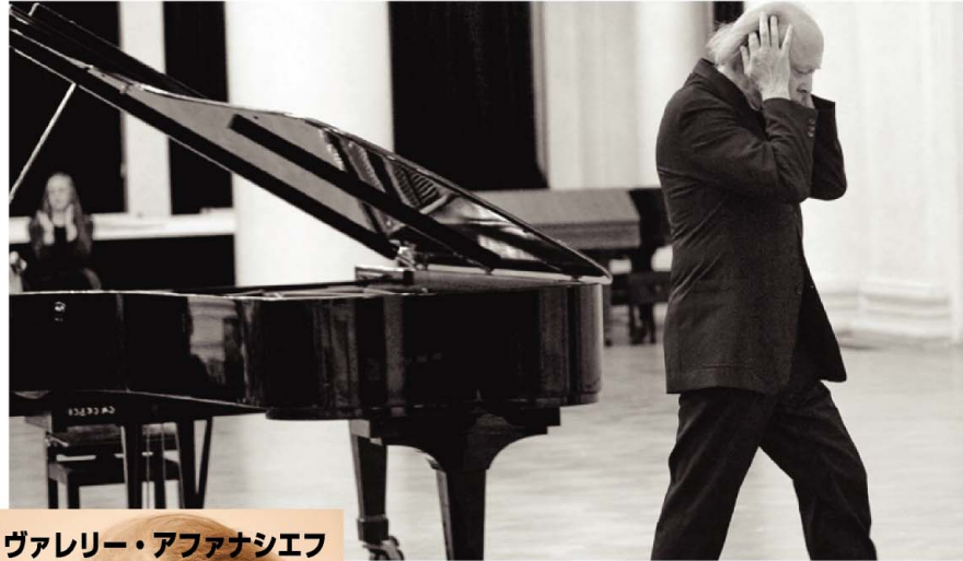
ヴァレリー・アフアナシエフ

シューベルトの音楽から聴こえてくる、さびしさと孤独の影、どのようにしても届かない、遠いあこがれ。ロシア生まれの巨匠が、ついに至った透徹した世界。